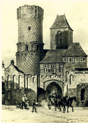
Lithografie von F. E. Meyerheim, 1833

Das Stadttor ist ein ursprünglich aus drei Teilen bestehender Wehrbau: dem Außentor, einem zwingerartigen Hof über einer steinernen Brücke und dem von 2 Türmen flankierten Innen- bzw. Haupttor.